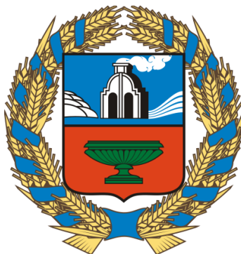
СХЕМА ТЕПЛОСНАБЖЕНИЯ С. ТРОИЦКОЕ ТРОИЦКОГО РАЙОНА АЛТАЙСКОГО КРАЯ НА ПЕРИОД С 2024 ГОДА ДО 2034 ГОДА (Актуализированная редакция)